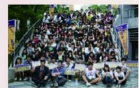
《理財大富翁夏令營》

銀行業2014年起啓動「亞洲盃」及「世界盃」海外布局，根據中華徵信所5000大企業排名，100大金融業在2014年的營收表現，出現兩位數的強勢增長，營收淨額由2013年的5兆2.123億元上升到5兆7.702億元(成長率達10.70%)，遠強於500大製造業的4.01%及500大服務業的4.04%。除了寫下2011年以來連續四年創新高的記錄外，也是三年內第二度營收成長達兩位數，顯示金融業處於新的成長期。