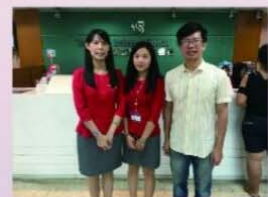
〈台新銀大四提前就業〉